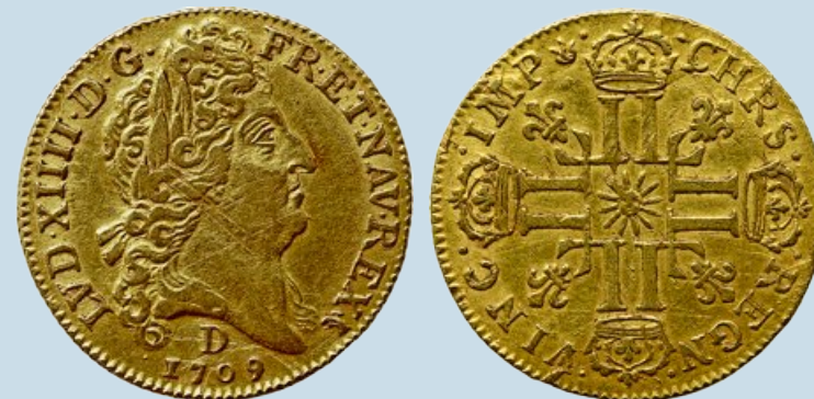
Le louis d'or au soleil (1709), sorti de l'atelier monétaire de Lyon.