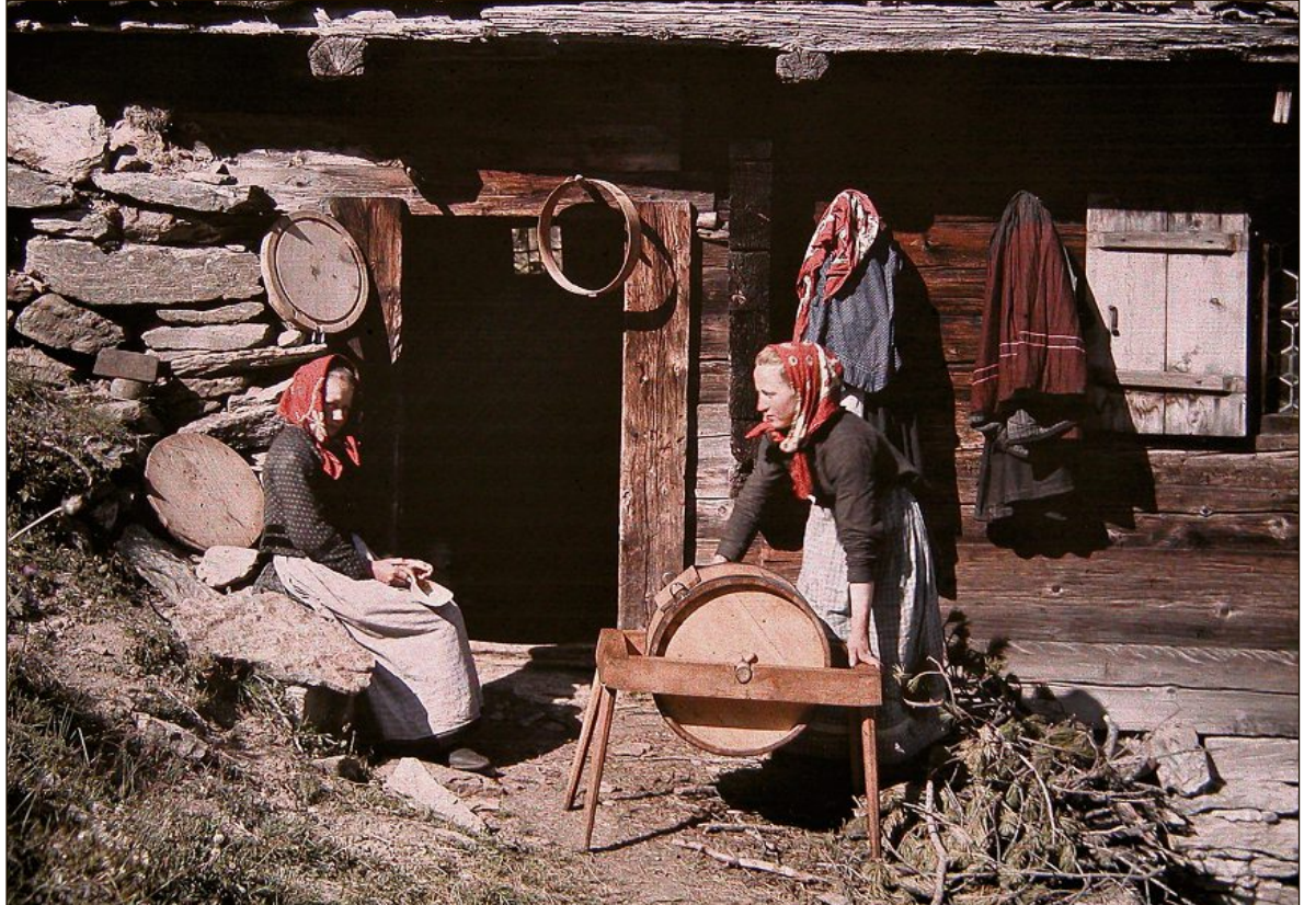
Le regard que la bourgeoisie portait sur la campagne idéalisée était très romantique: paysannes et baratte à beurre, 1917.

L a nouvelle exposition du Musée gruérien est consacrée à l'autochrome, la photographie diapositive couleur brevetée le 17 décembre 1903 par les frères Auguste et Louis Lumière. En plusieurs volets, elle propose un espace interactif de découverte de la lumière et de la couleur, un espace consacré aux premières techniques de reproduction de la couleur et un espace consacré aux premières photographies couleur de Suisse.